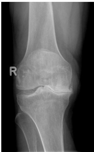
Vor der Operation